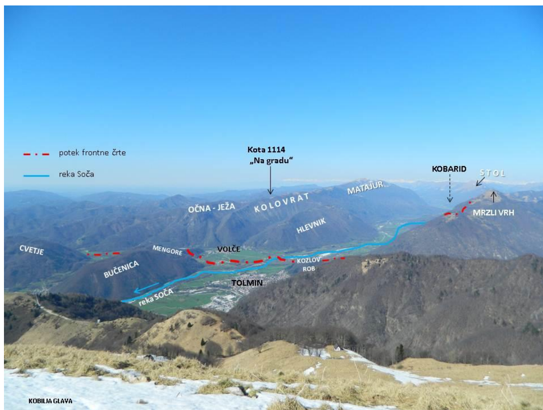
Slika 2: Pogled s Kobilje glave na mesto preboja na tolminskem mostišču

Načrtovanje je temeljilo na določitvi ciljev, točk osredotočenja, glavnih smeri in točk napada. Prvotni cilj ofenzive je bil potisniti italijansko vojsko približno 40 kilometrov stran od Soče in morda doseči posreden učinek tudi v Spodnjem Posočju. V premik frontne črte za reko Tilment takrat ni nihče verjel. Nemška ocena je bila, da bo uspeh ofenzive že v tem, če Italijanom ne bo uspelo izvesti ofenzivne akcije do spomladi 1918. Načrtovalci so pri izbiri točk osredotočanja napada prepoznali predvsem delovanje italijanske ognjene podpore na taktični ravni ter delovanje sistema poveljevanja in kontrole na operativno-taktični ravni. Italijanske artilerijske enote so bile razporejene za ofenzivno delovanje, torej bližje frontni črti, kar bi lahko pomenilo kritično ranljivost napada že na izhodiščni črti. Kritično točko na italijanski strani pa je predstavljal centraliziran sistem vodenja in poveljevanja, ki ni omogočal pravočasnega odzivanja na hitre in nepredvidljive spremembe na bojišču. Posledično je bila vsa vojskovalna moč napadalca osredotočena na italijansko artilerijo, na sistem poveljevanja in kontrole ter v bojni duh oziroma voljo do boja italijanskih vojakov. Točki osredotočenja pri nemški vojski sta bili uporaba doktrine nelinearnega bojevanja ter koncept vodenja in poveljevanja, na kar Italijani v tistem času niso poznali učinkovitega odgovora (Torkar in Kuhar, 2018).