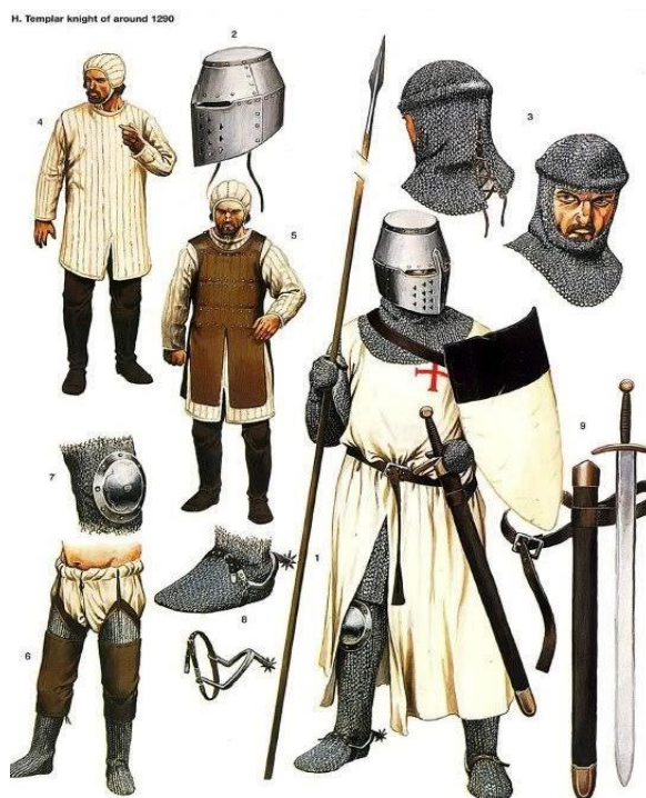
Slika 1: Viteška oprema