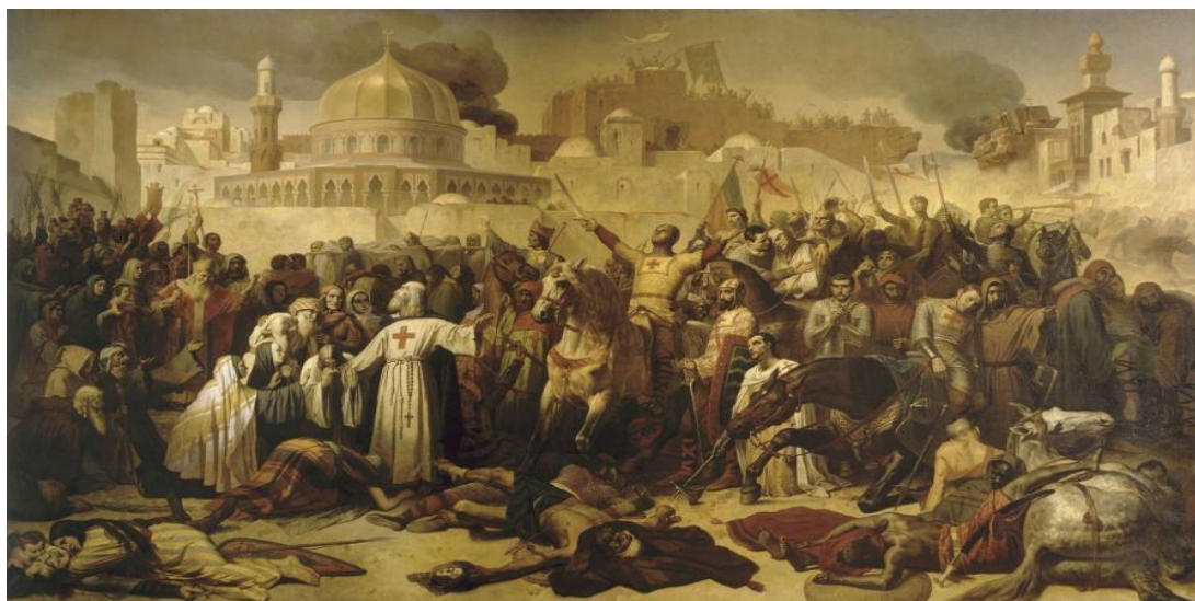
Slika 4: Zmagoslavje križarjev