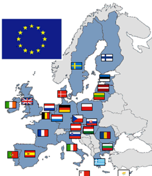
Slika 2: Države članice EU