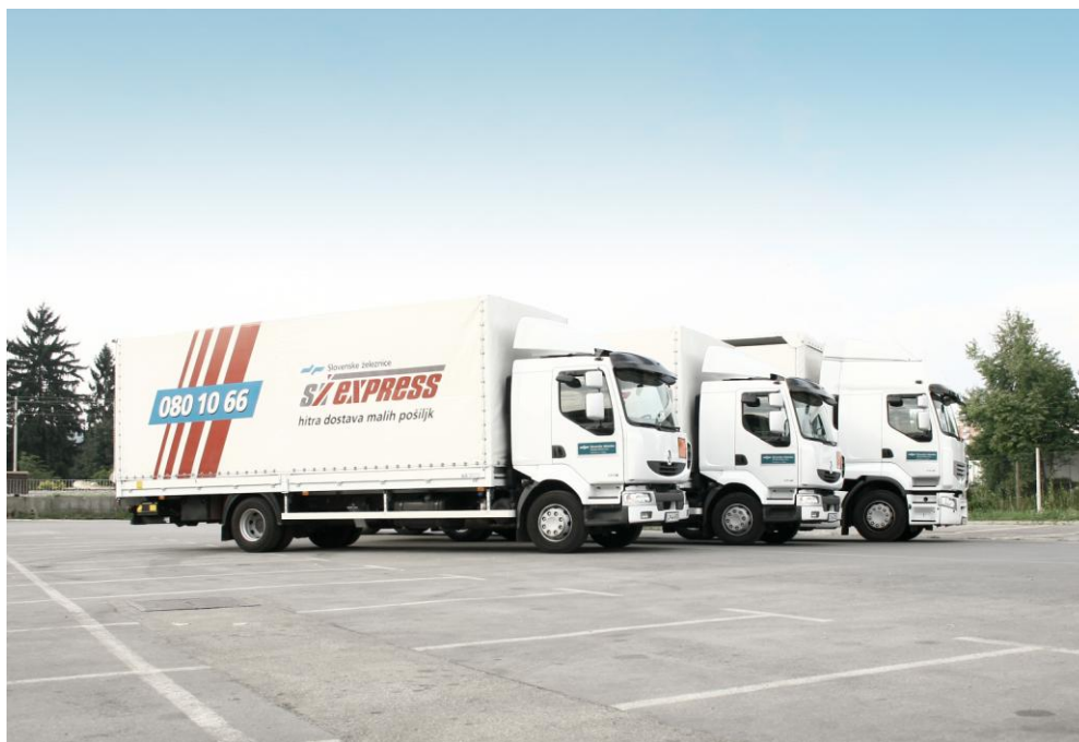
Slika 1: Cestna vozila za dostavo malih pošiljk

V sklopu logističnega centra je Javno železniško carinsko skladišče tipa A v izmeri 1671,80 m 2 , od tega je 135 m 2 namenjenih za začasno hrambo.