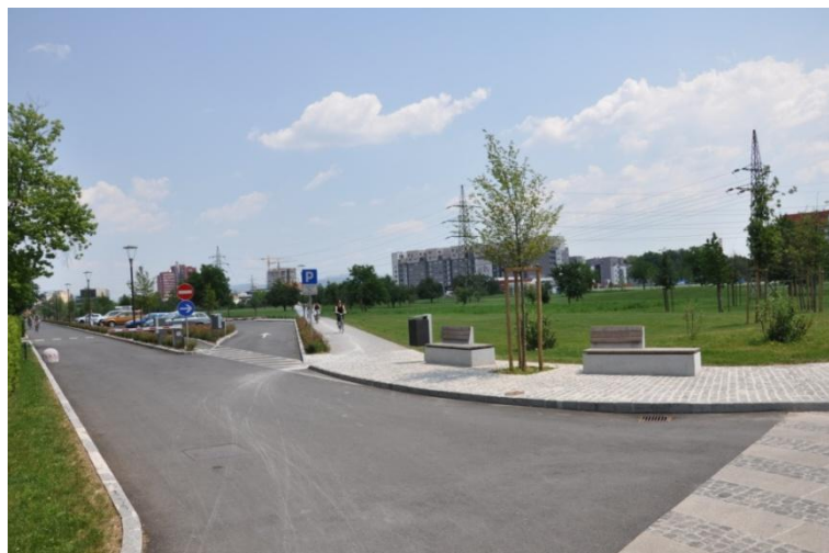
Slika 6: Parkirišče Žale II.