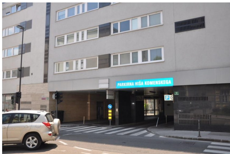
Slika 9: Parkirna hiša Komenskega