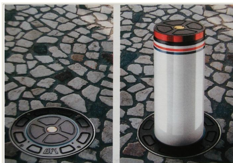
Slika 13: Avtomatski dvizni stebriček