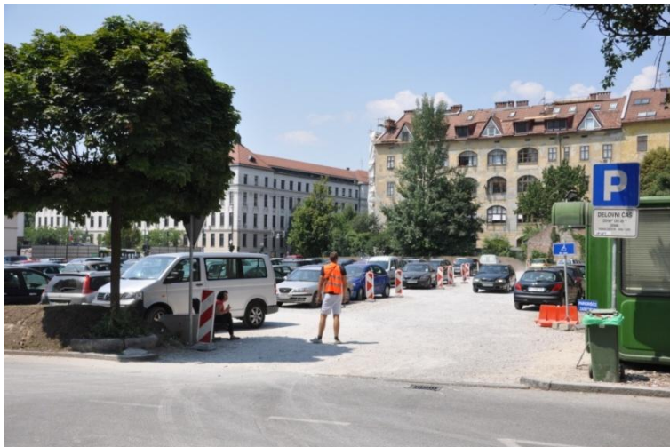
Slika 5: Parkirišče NUK