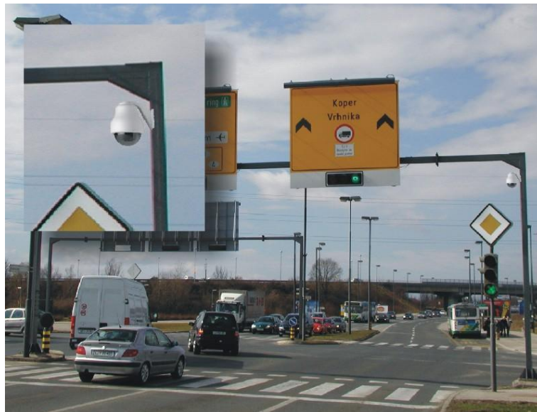
Slika 15: Nadzorne kamere