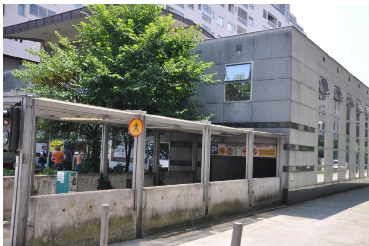
Slika 2: Parkirna hiša Kozolec