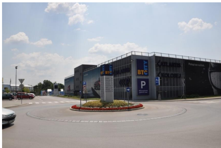
Slika 8: Parkirna hiša BTC City

Parkirna hiša BTC City na Šmartinski cesti 152 (GPS: 14,32 48/46,04 08) obsega 758 brezplačnih parkirnih mest, Parkirna hiša Citypark pa 1.270. Hiši sta večinoma opremljeni s sistemom elektronskega nadzora.