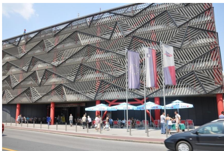
Slika 7: Parkirna hiša Šentpeter