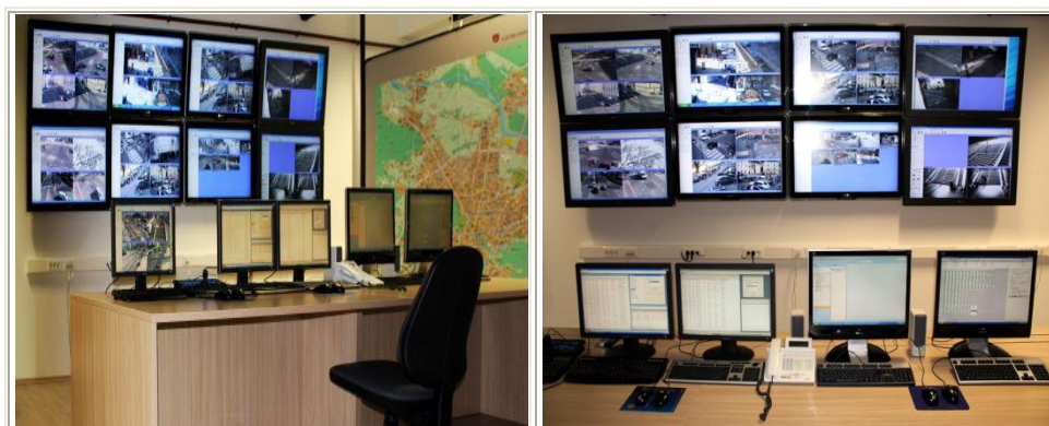
Slika 12: Nadzorni center