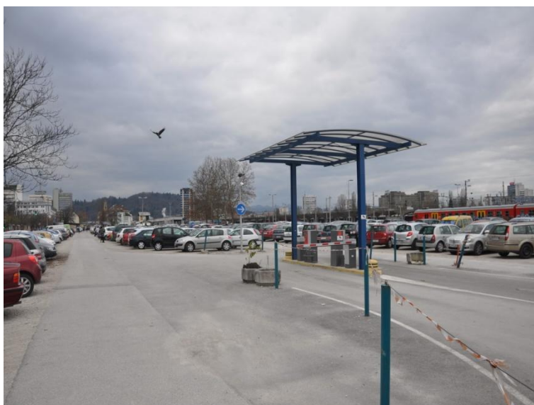
Slika 11: Parkirišče Železniška postaja Ljubljana