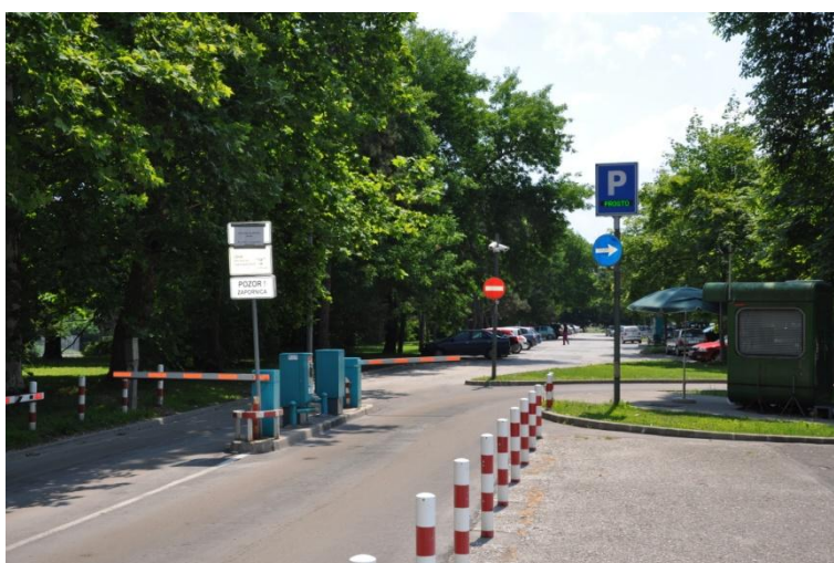
Slika 4: Parkirišče Tivoli II.