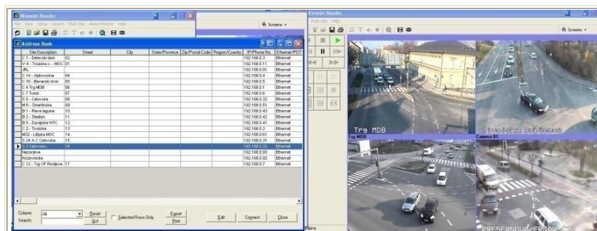
Slika 14: Videonadzor prometa

Sistem videonadzora omogoča pregled nad dogajanjem določenega območja. S kamerami se nadzoruje prometne tokove in pretočnost prometa v povezavi s semaforским sistemom ter delovanje sistema na območjih umirjanja prometa. V nadzornem centru je računalnik s programsko opremo za komunikacijo in obdelavo signala. Alarmno snemanje dogodkov se sproži preko povezave s semaforско krmilno napravo in detektorjem gibanja videonadzorne enote. Barvne videokamere na prostem so v posebnih zaščitnih ohišjih, ki jih ščitijo pred vremenskimi vplivi ter morebitnimi poškodbami.