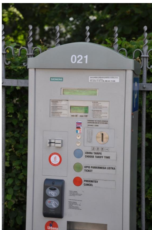
Slika 1: Parkomat