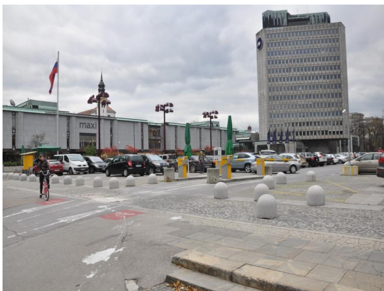
Slika 10: Parkirišče Trg republike