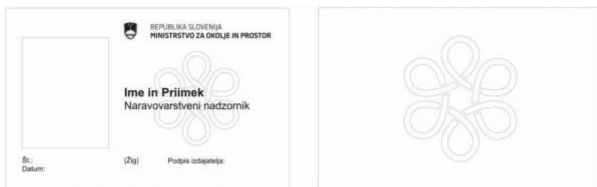
Slika 3: Izkaznica naravovarstvenega nadzornika