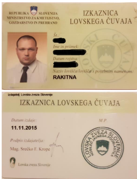
Slika 7: Službena izkaznica lovskega čuvaja