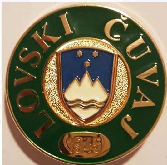
Slika 8: Službeni znak lovskega čuvaja