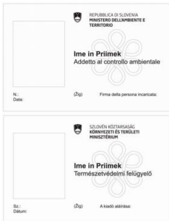
Slika 5: Dvojezična izkaznica naravovarstvenega nadzornika

Na z zakonom določenih območjih, kjer živita avtohtoni italijanska in madžarska skupnost, se izda izkaznica v dveh jezikih.