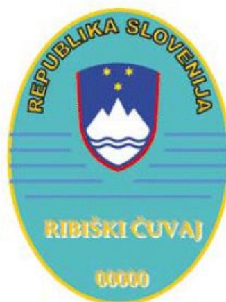
Slika 10: Službeni znak ribiškega čuvaja