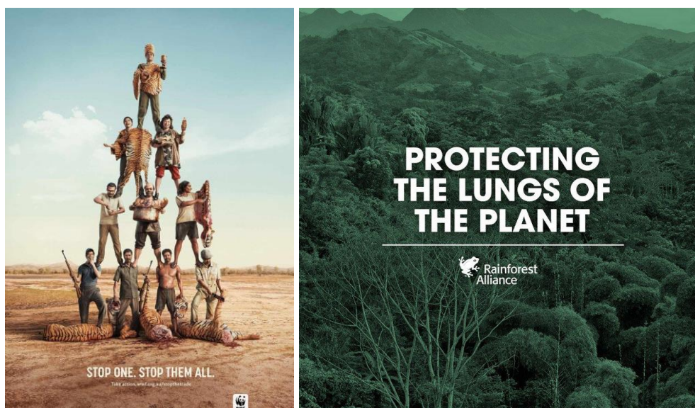
Slika 1: Primeri plakatov

Iz vseh medijev in literature, ki nam je na voljo, lahko razberemo, da se je človek kot največji plenilec v okolju povzpел na tako visoko stopnjo, da je trenutni absolutni gospodar in tudi uničevalec tega planeta. Ravno s te pozicije je tudi edini, ki lahko zmanjša in poskuša vplivati na spremembe in storjeno škodo na tem planetu.