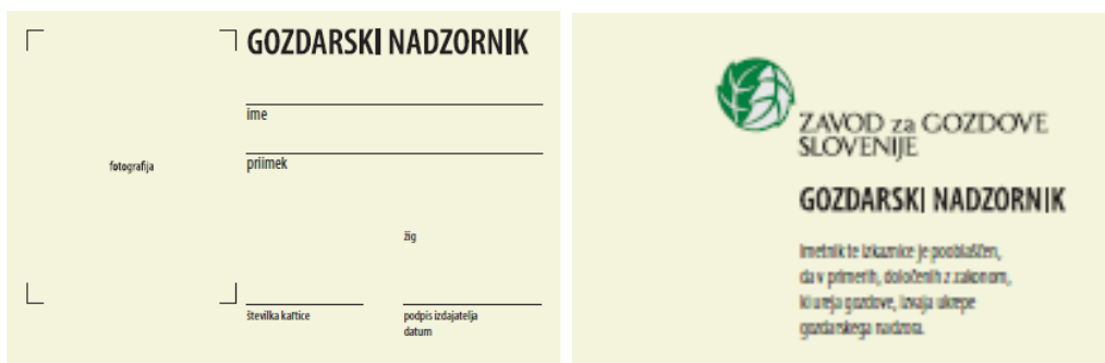
Slika 11: Službena izkaznica gozdarskega nadzornika