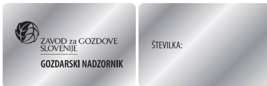
Slika 12: Službeni znak gozdarskega nadzornika