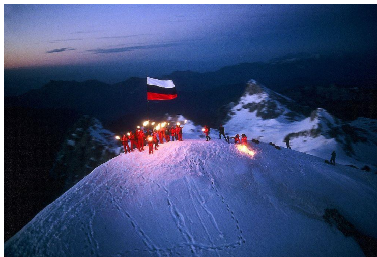
Slika 8: 12. junij: slovenska zastava plapola na Triglavu

7. julija so vodstva Slovenije, Hrvaške in Jugoslavije pod budnim očesom Evropske skupnosti sprejele »Brionsko deklaracijo« 19 . S tem dejanjem so se končali boji po Sloveniji (Alidžanović et al., 2016, str. 119–120).