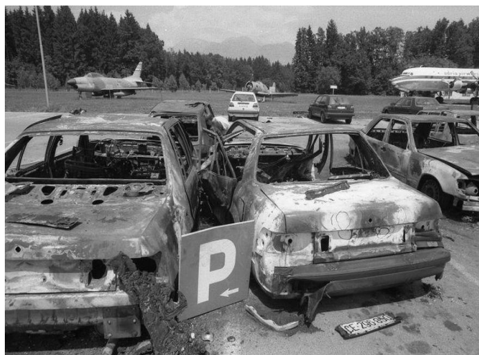
Slika 5: Brnik po letalskem napadu

Po nočnih napetostih in premeščanju sil ter zavedanju o možnosti letalskega delovanja se je grožnja tega dne v dopoldanskih urah uresničila. V prvem naletu so letala JVL delovala po položajih, kjer so bile ponoči nameščene slovenske sile. Z vidika mednarodnega vojnega prava je bilo to delovanje legitimen cilj. Drugi nalet bi lahko kategorizirali kot vojno hudodelstvo, ker so letala napadla hangar milice in letalskega prevoznika ter sam glavni objekt letališča. Storzena je bila materialna škoda na letalih, poslopju in vozilih na parkirišču. Po letalskih napadih je zaokrožilo obvestilo o možni uporabi bojnih strupov, kar je neugodno vplivalo na duh in morale pripadnikov enote.