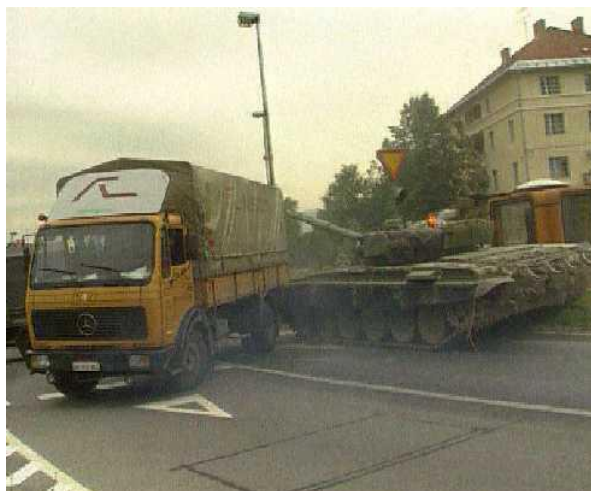
Slika 3: Barikada v Šentvidu (Vir: Wikipedija, 2018)

Z območja Karlovca se je premikala protiletalska enota preko Metlike in Novega mesta proti letališču Brnik, vendar na cilj ni nikoli prišla. Ta enota je imela velike težave v smislu organizacije in bojnih stikov na svoji poti. Na koncu se je neuspešno poizkušala umakniti na Hrvaško (Švajncer, 1993, str. 37–45).