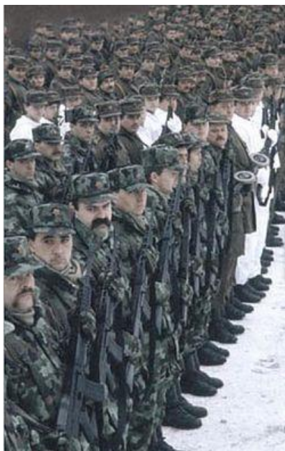
Slika 2: Postroj 30. razvojne skupine TO v Kočevski reki 17. decembra 1990

na Kosovu je bila kriza. Takrat je bila v Sloveniji prepoznana zgodovinska priložnost za ustanovitev lastne države, v kateri bomo sam svoj gospodar.