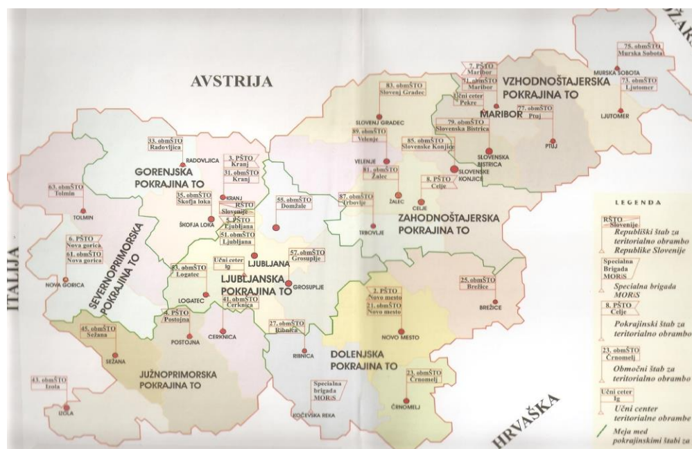
Slika 1: Razdelitev pokrajin TO (Vir: Kladnik, 2011)

3. pokrajinski štab Teritorialne obrambe (3. PŠTO) je pokrival območje Gorenjske. Poveljstvo štaba je bilo v Kranju. Poleg 31. območnega štaba TO (31. ObmŠTO), ki je pokrival območje Kranja, sta v pokrajini delovala še dva območna štaba TO, 35. ObmŠTO z lokacijo v Škofji Loki in 33. ObmŠTO, umeščen v Radovljici.