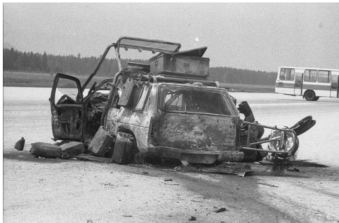
Slika 6: Uničeno vozilo avstrijskih novinarjev

novinarja avstrijskih televizij in tudi samo vozilo je bilo razpoznavno označeno s »PRESS« 17 . Novinarja sta umrla v napadu (Filipčič, 2011, str. 265).