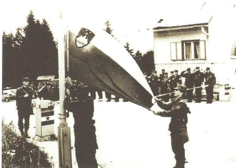
Ponovni dvig zastave 29. 6. 1991 ob 18. uri