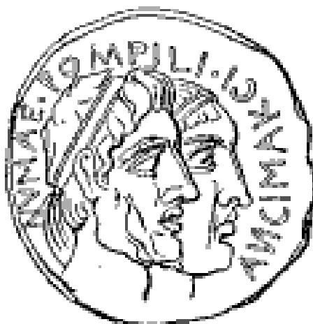
Slika 1: Kovanec s podobo dveh rimskih kraljev, Nume Pompilija in njegovega vnuka Anka Marcija

Po tradiciji je prvotno naselje ustanovil Romul leta 753 pr. n. št., in sicer 21. aprila. Ta datum so določili zgodovinarji s pomočjo matematika Taruncija in podatkov zgodovinarja Varona ter s podrobno preučitvijo horoskopa. Zgodnja zgodovina mesta Rim je izpričana z arheološkimi najdbami keramičnih izdelkov iz 13.–14. stoletja pr. n. št. in ostankov pokopališč blizu Palatina iz 10. stoletja pr. n. št. Zanimivo je, da so bili leta 2005 izkopani ostanki velike palače iz 8. st. pr. n. št., ki potrjujejo domneve, da slonijo legende o nastanku mesta na resnici, se pravi, da je bil Rim dejansko ustanovljen v tistem času. Čeprav je Cicero 1 trdil, da je postopek precej ekstravaganten, se je datum vključil v legendo. Seveda je legenda olepšala resnične dogodke, a domneva, po kateri naj bi se Rim iz primitivnega naselja preuredil v mesto v polovici osmega stoletja pr. n. št., postaja sprejemljiva. Arheološke najdbe govorijo v prid temu, da je na tem območju približno takrat res nastalo večje naselje. Za vso dobo kraljevine so bili podatki večinoma legendarni. Latinci in Sabinci so bili prvi štirje kralji, nato so jim sledili Etruščani. Doba kraljevine je trajala 243 let. Doba republike pa je najuspešnejše obdobje rimske civilizacije, ko je država dosegla hegemonijo nad celotnim Sredozemljem ter je pričela graditi zakonodajo, ki je bila pravzaprav podlaga za moderno pravosodje (Bratož, 2007).