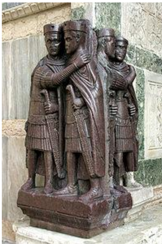
Slika 5: Tetrarhi, porfiri kip, ukraden iz bizantinske palače med četrto križarsko vojno leta 1204 (zakladnica sv. Marka, Benetke)

Po začetnem obdobju verske strpnosti je Dioklecijan kot vnet pogan postal zaskrbljen zaradi vedno večjega števila kristjanov. Začel jih je preganjati s takšno vneto, kakršne po Neronu cesarstvo ni poznalo. Njegova vladavina je bila eno najhujših obdobj preganjanja kristjanov v zgodovini (Ostrogorsky, 1961).