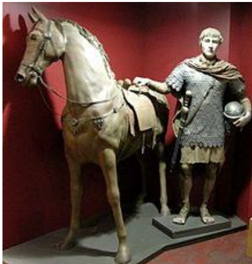
Slika 8: Prikaz konjenika v muzeju

n. št.). Razdeljena je bila v alae po 500 ali 1.000 mož, te pa v trume po 30–40 mož. Vsaki alai je poveljeval perfekt in imela je svoje znamenje – zastavo vexillum , trumi pa je poveljeval dekurion, njeno znamenje pa je bil axilum (Keegan, 2005).