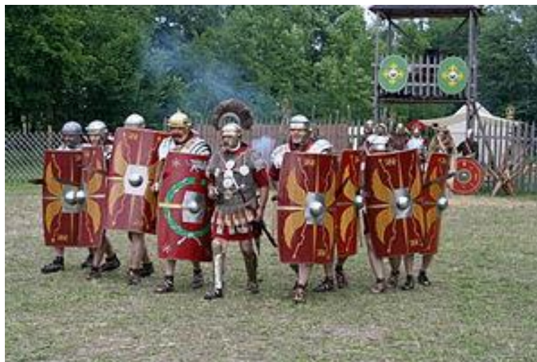
Slika 6: Kontubernij v napadu – sodobna rekonstrukcija (Vir: Gabba et al., 1999)

Kontubernij je imel tudi dva »služabnika«, ki sta skrbela za kontubernijsko mulo in na pohodih za pitno vodo. Pogosto sta bila tudi izučena obrtnika, na primer kovača ali tesarja (Keegan, 2005).