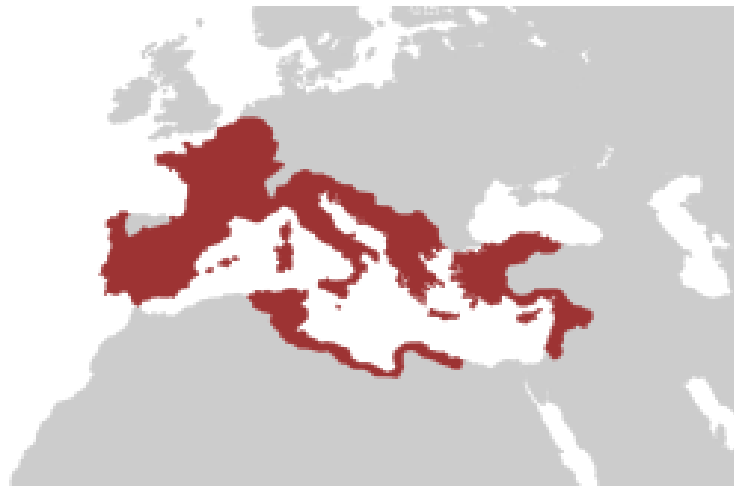
Slika 2: Razsežnost republike leta 45 pr. n. št.