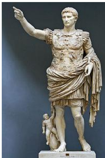
Slika 3: Gaj Avgust Oktavijan, prvi rimski cesar v obdobju principate (Vir: Gabba et al., 1999)

Po dolgem obdobju državljanskih vojn v 1. stoletju pr. n. št. si je cela italska družba začela prizadevati za mir in Pax Romana je postal moto, ki je združil različne plasti rimske družbe. Najbolj aktivni Oktavijanovi nasprotniki so bili v vojnah ubiti, tisti, ki so preživeli, pa so bili politično oslabljeni in demoralizirani. Nemiri in vojne so prispevali tudi k popularizaciji ideje o srečnih preteklih časih in preprostem življenju pobožnih prednikov. V skladu s temi težnjami se je obnašal tudi Oktavijan, ki je kmalu po vrnitvi v Rim leta 29 pr. n. št. začel obnavljati templje. V Rim se je vrnil kot edina oseba, ki je imela vojaško moč v celem cesarstvu in je lahko uredila politične razmere v državi. Vojaška moč seveda ni bila združljiva z urejenimi političnimi procesi, ki jih je želel spodbuditi, poleg tega pa mu je bila očitno zoprna tudi vloga vojaškega despota. Od te vloge so ga odvrčale predvsem usoda Julija Cezarja, močna želja po legitimnosti in ugledu ter spoštovanje do običajev prednikov. Po lastnih besedah je želel postati ustvarjalec najboljše možne civilne vlade (Maškin, 1991).