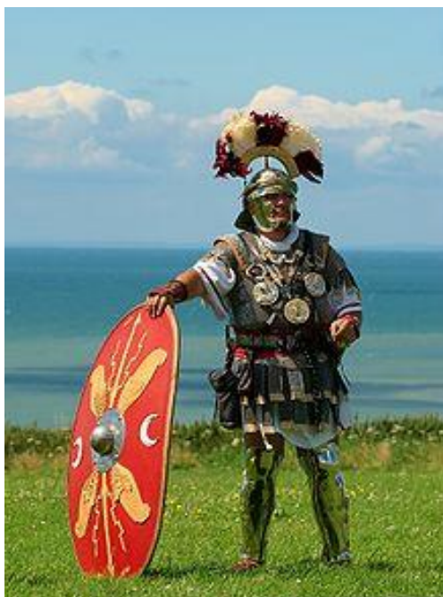
Slika 9: Rekonstrukcija uniforme rimskega centuriona, prečna perjanica na čeladi – galea – bi lahko pomenila njegov rang

V bitkah na dogovorjenih bojiščih so se pred prvo bojno vrsto postavili veliti in z metanjem kopij krili napredovanje hastatov. Če hastatom ni uspelo streti nasprotnika, so se umaknili. Na njihovo mesto so stopili princepsi in če tudi njim ni uspelo, so v bitko posegli triariji, od katerih je bil odvisen izid bitke (Keegan, 2005).