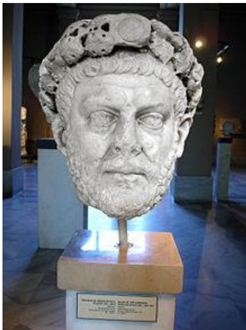
Slika 4: Dioklecijan

Dioklecijan je ukinil videz republike in uvedel sistem štirih monarhov, imenovan tetrahija. Oblast v cesarstvu sta si delila dva socesarja – avgusta in dva njima podrejena mlajša cesarja – cezarja (Ostrogorsky, 1961).