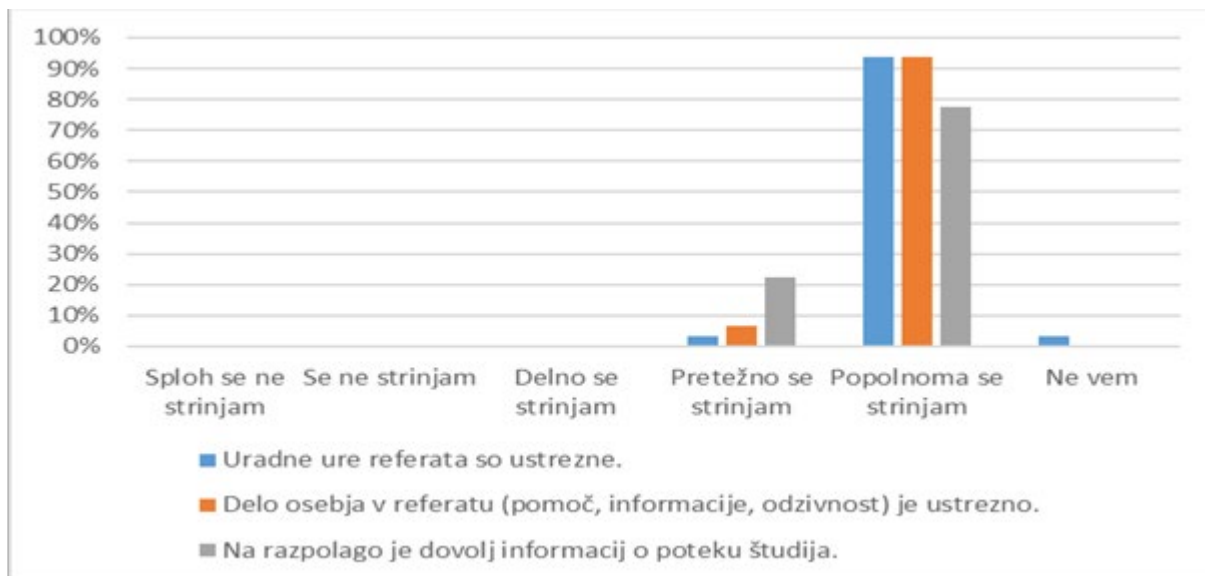
Slika 3: Študenti ocenijo delovanje šole

Imamo vzpostavljeno ustrezno kadrovsko strukturo, po številu in kakovosti primerno za izvajanje dveh študijskih programov in strokovne dejavnosti, kar je razvidno iz imenovanj. Vsi predavatelji so izvoljeni v naziv višješolski predavatelj, v imenovanje. Oceno študentov pridobimo z anketnimi vprašalniki o zadovoljstvu študentov. Na 4 stopenjski lestvici je pozitivno mnenje študentov, če predavatelj doseže vsaj oceno 2,6. Noben predavatelj ni bil ocenjen pod to mejo. Če bi bil, bi strokovni sodelavec ali dekan opravil z njim pogovor in bi skupaj poskušala najti možnosti za izboljšave.